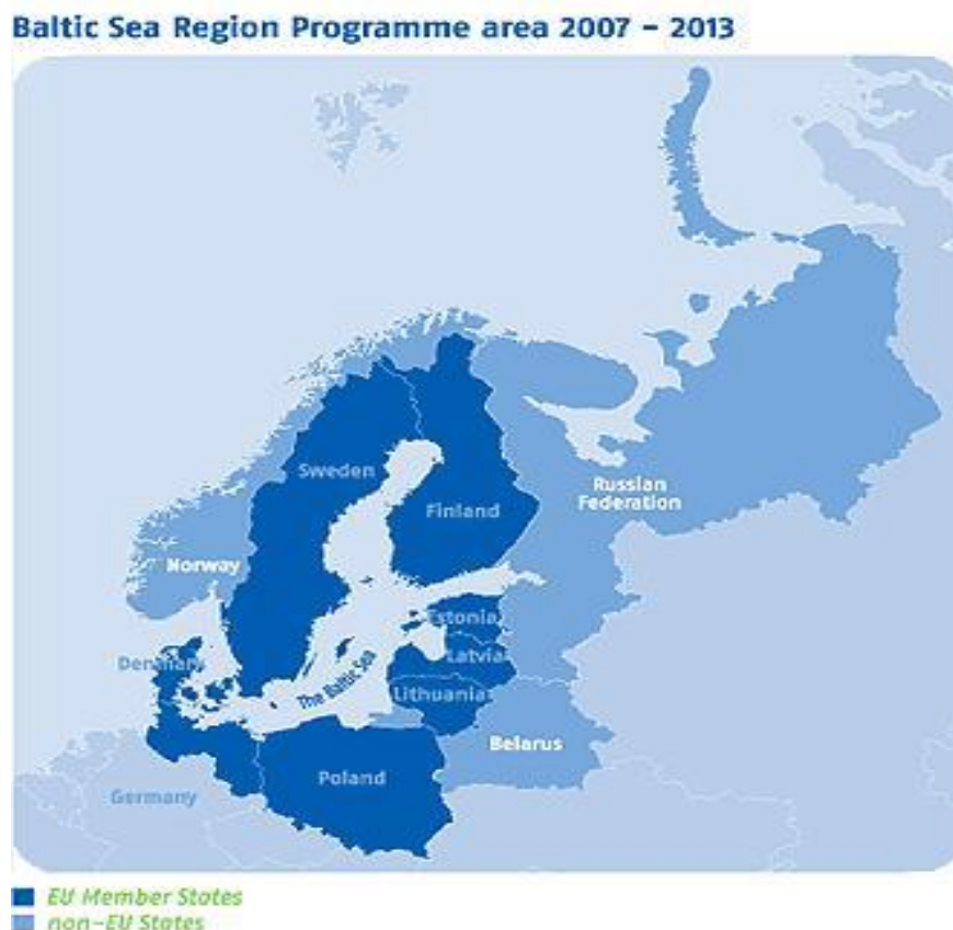
Joonis 4. Läänemere piirkonna programmi piirkond

Need piirkonnad peavad olema NUTS 2 piirkonnad või samaväärsena määratletud piirkonnad.“