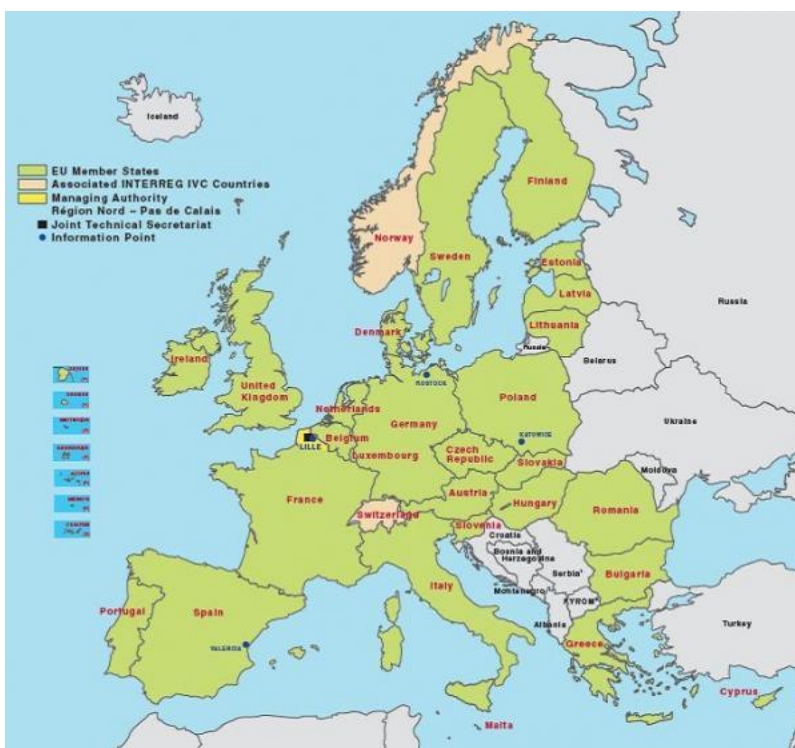
Joonis 5. Interreg IVC programmipiirkond

Vastavalt EL territoriaalse koostöö määrusele peab piirkondadevahelise koostöö puhul ERFi antav toetus hõlmama kogu liidu territooriumi. Piirkondadevahelise koostöö programmid võivad hõlmata ka „...äärepoolseimate piirkondadega piirnevate kolmandate riikide või territooriumide piirkondi“.