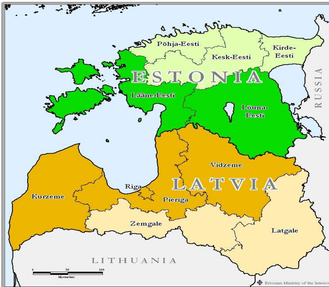
Joonis 1. Eesti-Läti piiriülese koostöö programmi piirkond

Eesti-Läti piiriülese koostöö programmi piirkonda kuuluvad Eesti poolt NUTS 3 piirkonnad Lõuna-Eesti (Jõgevamaa, Põlvamaa, Tartumaa ja Tartu, Valgamaa, Viljandimaa ja Võrumaa) ning Lääne-Eesti (Hiiumaa, Läänemaa, Pärnumaa, Saaremaa). Lätist kuuluvad programmipiirkonda Kurzeme, Pierīga ja Vidzeme regioonid ja Riia linn.